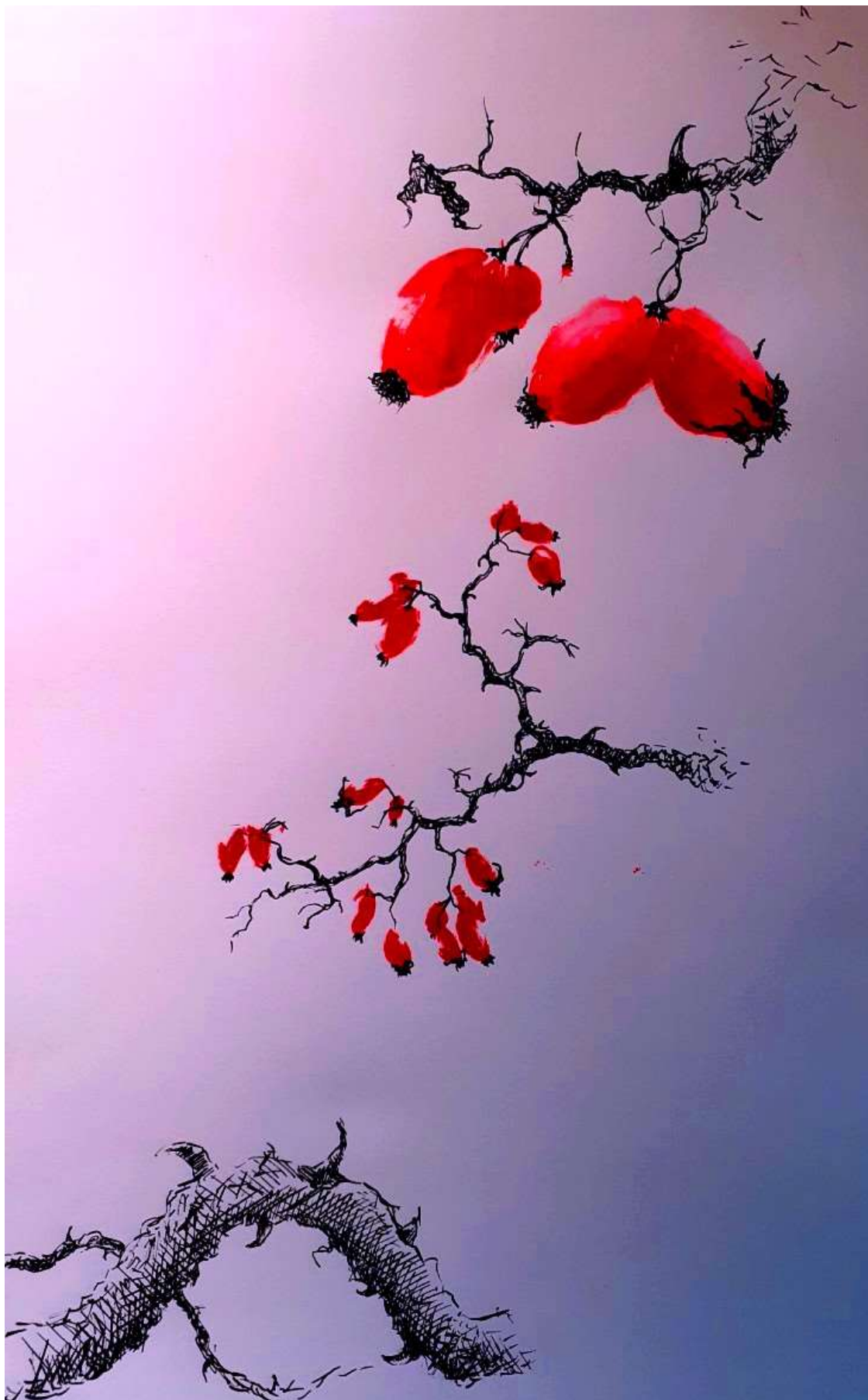
Tomáš Vašek, 2. C