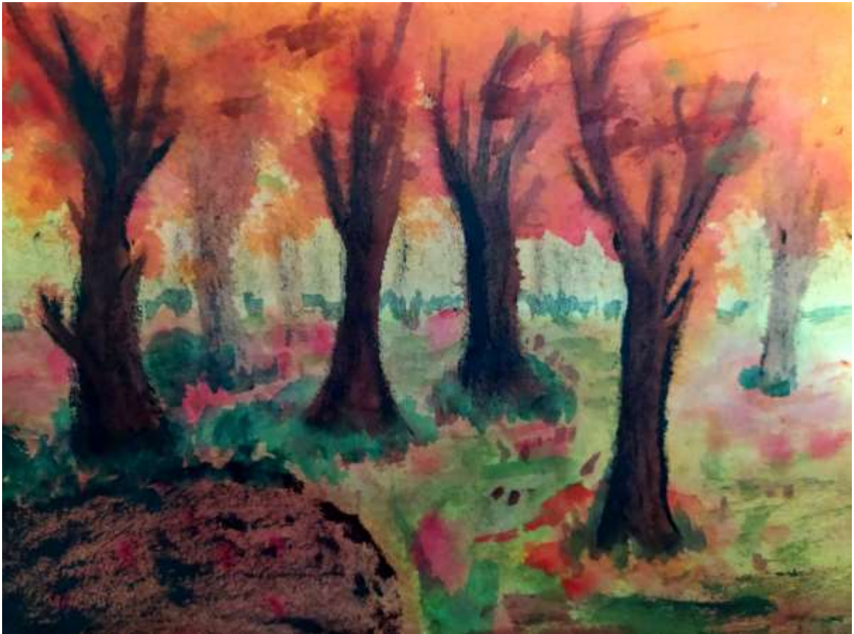
Viktorie Panáková, 4. A