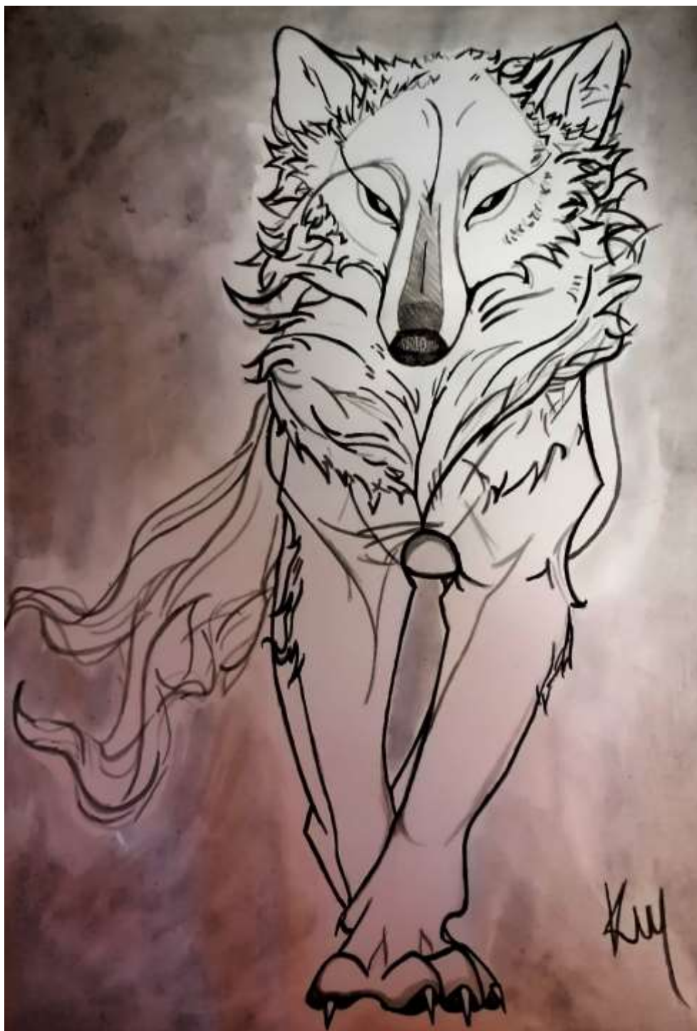
Barbora Kubalová, 3. A