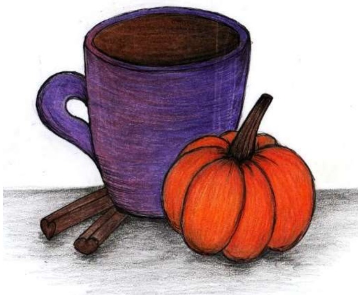
Dominika Šedivá, 3. A