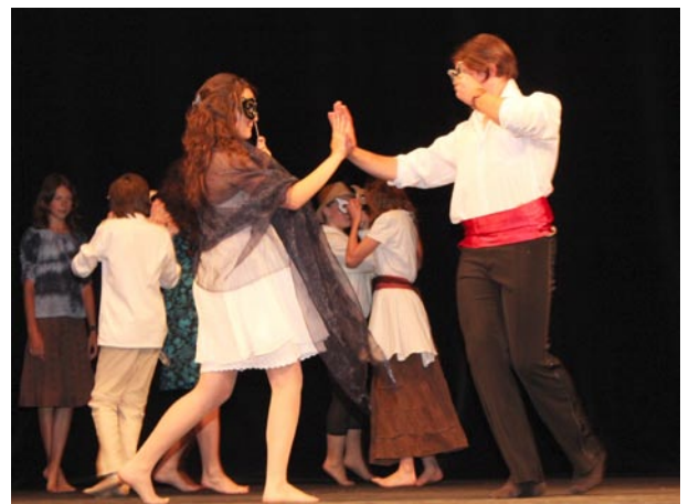
Romeo a Julie