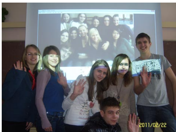
Videokonference s Litvou

By Copot Diana-Catalina, Romania (bez korektury)