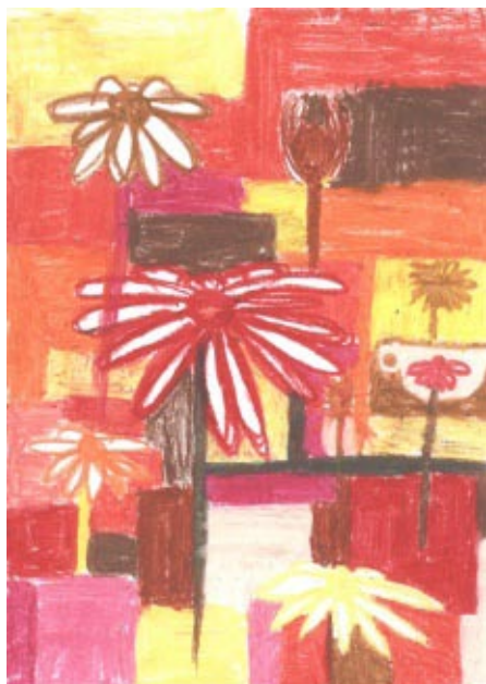
Zuzana Saltzmanová, 6. A