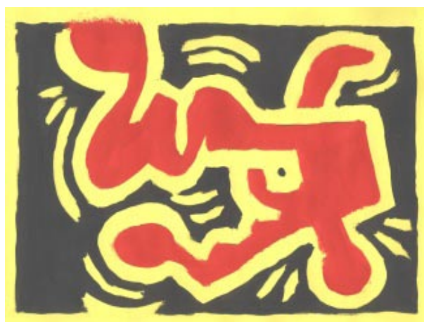
Klára Drazdíková, 4. C