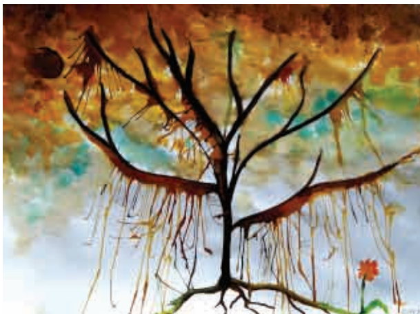
Dagmar Ludačková, 2. C