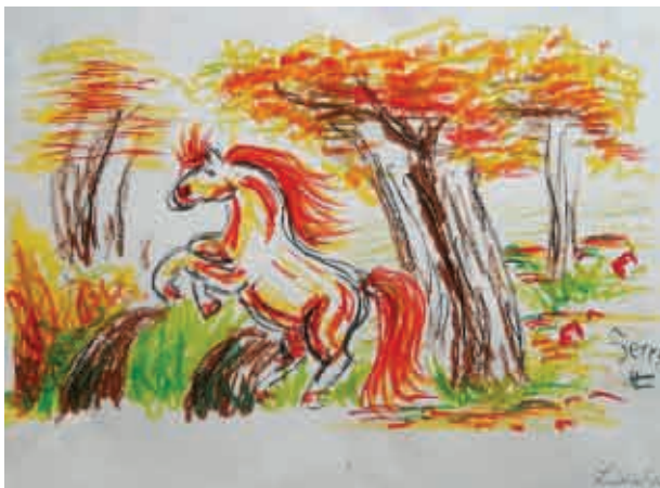
Tereza Lukešová, 4. A