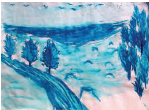
Tomáš Kuchař, 1. C