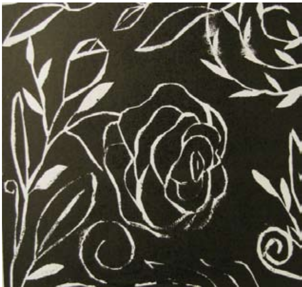
Lucie Pecholtová, 4. C