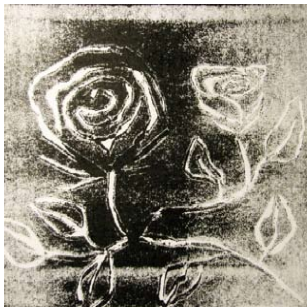
Lucie Trnková, 4. C