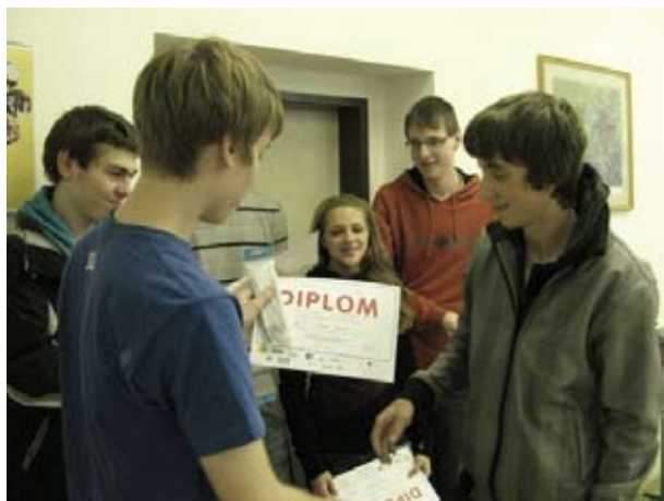
pišQworky, oblastní kolo, Sedlčany