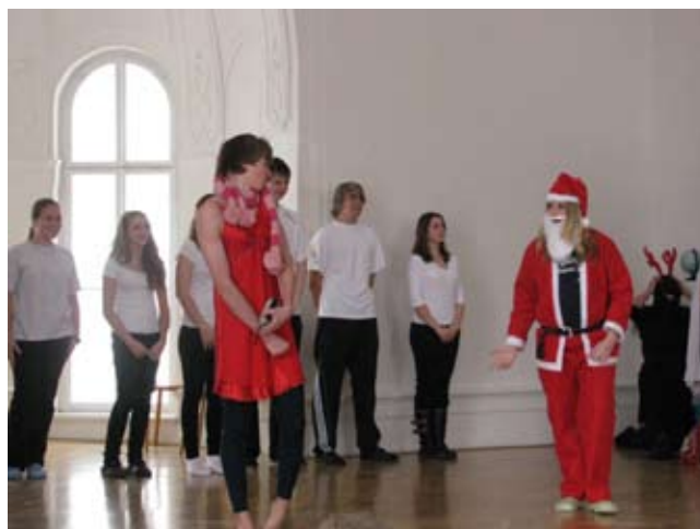
z vystoupení dramatického kroužku