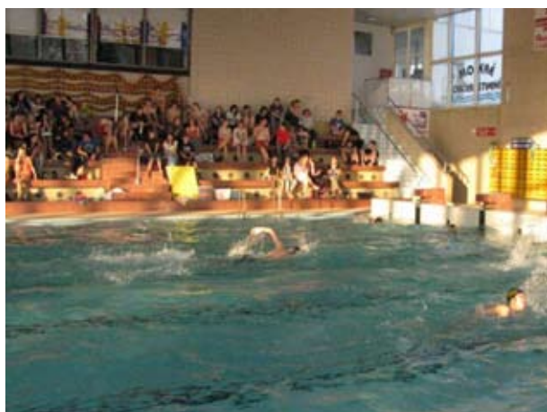
vánoční soutěž v plavání